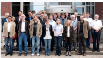
Feldversuche 20.07.2012 (Oldenburg), 11. Forschungstag