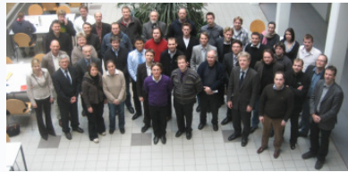
Technische Plattform und Sensorik 21.01.2010 (Braunschweig), 5. Forschungstag