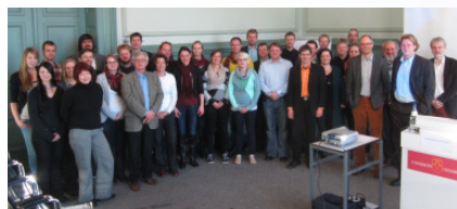
Assistive Technologien und Ethik 30.11.2012 (Osnabrück), 12. Forschungstag