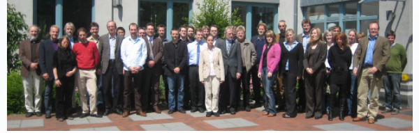
Soziologische und ökonomische Aspekte des Forschungsverbunds GAL 13.06.2009 (Vechta), 3. Forschungstag