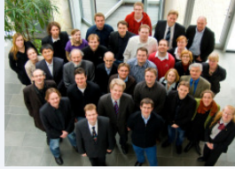
Pflegewissenschaftliche Aspekte und technische Assistenzsysteme 13.03.2009 (Oldenburg), 2. Forschungstag