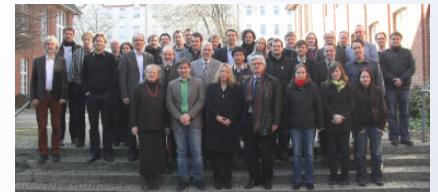
Entstehung, Prävention und Therapie des geriatrischen Syndroms Sturz 26.02.2011 (Berlin), 8. Forschungstag