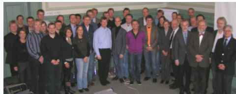
Datenschutz und MCI/ Demenz 05.11.2010 (Osnabrück), 7. Forschungstag