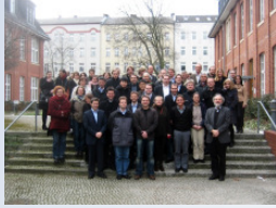
Multimodales geriatrisches Assessment 14.02.2009 (Berlin), 1. Forschungstag