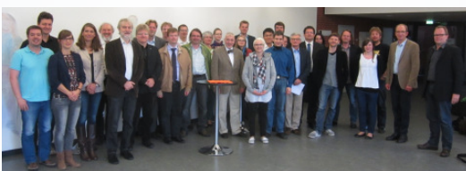
Technikbereitschaft und Akzeptanz 14.06.2013 (Vechta), 14. Forschungstag