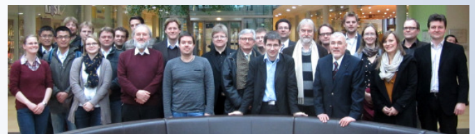
Moderne Geriatrie 01.02.2013 (Lingen/ Ems), 13. Forschungstag