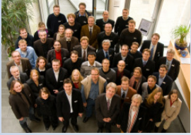
Konstituierung 28.11.2008 (Oldenburg)