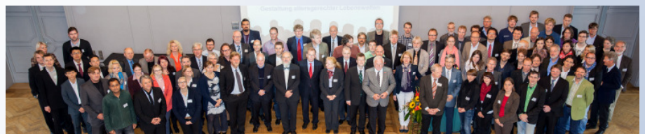
GAL-Abschluss-symposium 18.09. – 19.09.2013 (Braunschweig)