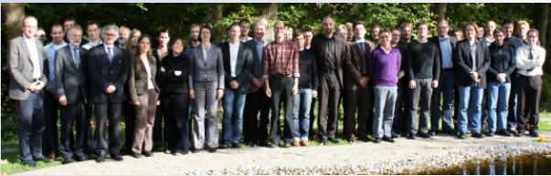
Nutzungsschnittstellen 09.10.2009 (Oldenburg), 4. Forschungstag