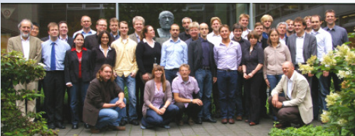
Körperliche Aktivität und Training im höheren Lebensalter – Präventive, therapeutische und rehabilitative Aspekte 27.08.2010 (Hannover), 6. Forschungstag