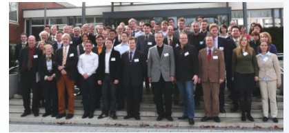
Konferenz „Ageing & Technology“ 23.03. – 25.03.2010 (Vechta)